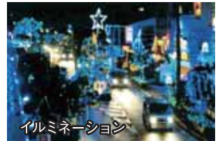
イルミネーション

平成17年に老青会やOB会が中心となって経塚イルミネーション実行委員会が結成され、電球の点検から飾り付け、点灯式の実施や交通整理まですべて行っています。10年余経過した今、ふるさとの風物詩としてインターネットにも掲載されるなど注目され、経塚住民はもちろんのこと、浦添市内や県内各地からもたくさんの訪問者でにぎわっています。毎年この時期になると子供だけでなく大人達の目もきらきらと輝き毎年楽しみとされています。