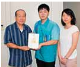
浦添市宮城2-24-2 有限会社 あい保険工房 様より 図書券30,000円分 ※47回目