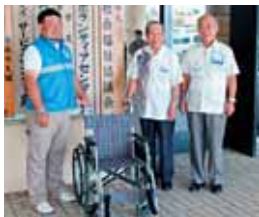
浦添市牧港1-24-1 1F 琉球新報 牧港・下港川販売店 様より 車イス 1台