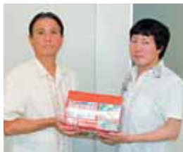
南風原町字大名275番地 医療法人 正清会 様より 学習図書 日本の歴史16巻セット