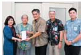
浦添市安波茶2-1-3 101号 労金浦添地区推進委員会 様より 50,700円 ※チャリティボウリング大会 開催により「浦和寮」へ 指定寄附