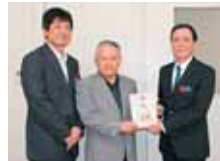
浦添市勢理客1-1-6 株式会社 善林堂 様より 100,000円