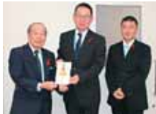
浦添市牧港5-2-1 おきでんグループ ボランティア互助会 様より 200,000円