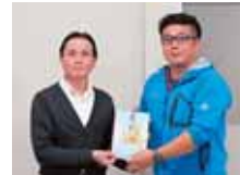
うるま市石川赤崎2-2-1 株式会社 タバタ 様より 500,000円