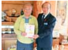
浦添市伊祖4-15-1 有限会社 丸豊商事 様より 300,000円