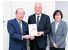
浦添市西洲2-6-6 沖縄県卸商業団体 協同組合 様より 100,000円