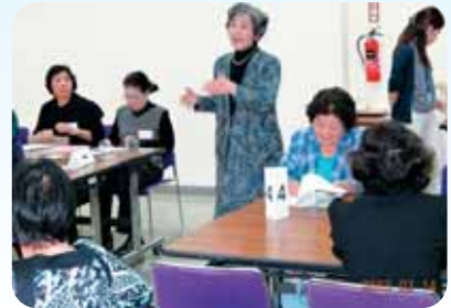
グループワークでは、サロンの課題と解決策をみんなで考えました。