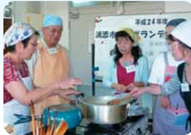
調理実習では、じゃがいもギョーザをはじめ、豆乳スープ、紅イモプリンを作りました♪