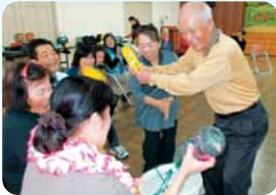
レクリエーション講座では、体を動かす楽しい内容に受講生のみなさん大笑い!

レクリエーション講座や調理実習、介護予防など、内容盛りだくさんの講座に、受講したみなさん「講座で学んだことをさっそく地域で実践したい!」と意気込んでいました。