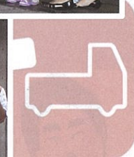
が働く作業所に支援