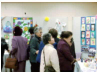
「いきいき作品展」プロ顔負けの作品ぞろい!