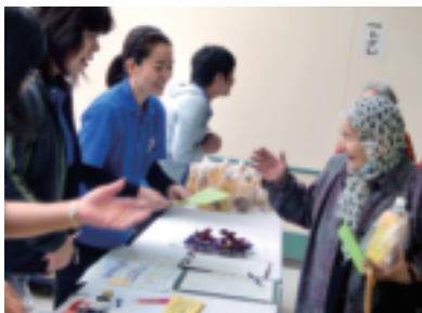
みい-どろ-さい! (久しぶりだね~!)

今年度一年間の皆勤賞、90歳以上の方を対象としたがんじゅう賞の表彰式や、ゲスト出演などなど……。同時に「いきいき作品展」も開催され、会場は大賑わいでした。