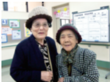
毎年ここで会うのが楽しみね♪