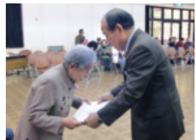
受賞おめでとうございます★