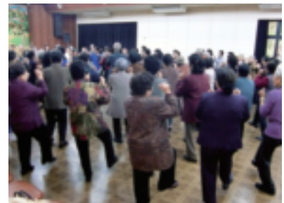
みんなでレク踊り! 足どりも軽やかです。