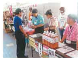
役所内での販売活動

毎月第2日曜日の「ふれあいフリーマーケット」の開催、車いすふれあいサッカー大会や、浦添市バドミントンまつりへの共催、市社協が実施する福祉推進事業(小学校での福祉体験学習等)への協力や、毎年8月の「ボランティア月間」の推進、フードドライブ活動や浦添市からの委託事業(浦添市福祉プラザ・「声の広報」音訳事業等)があります。また、夏休み期間中に子ども向け講座やミニバザー&ボランティア体験などのイベントを毎年開催しています。 奇数月には定例会を行い、加盟団体の情報交換や交流を図りながら活動を進めています。