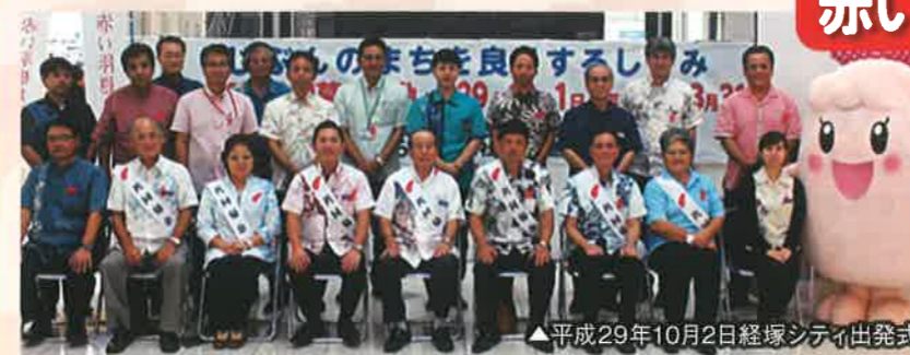
▲平成29年10月2日経塚シティ出発式