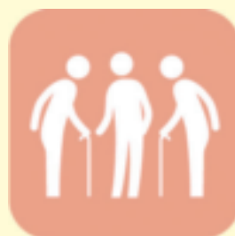
高齢者向けサロン