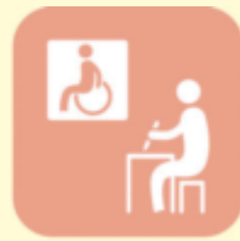
福祉教育・市民学習