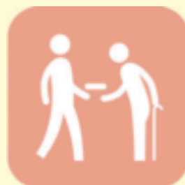
高齢者への配食サービス