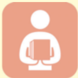
福祉情報を伝える