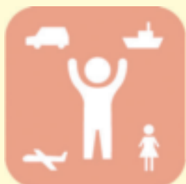
障がい児の おもちゃ図書館