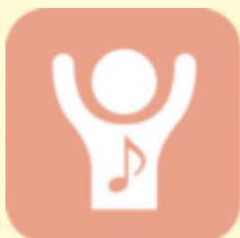
知的障がい者の 音楽療法