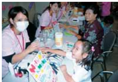
癒し体験にうっとり...