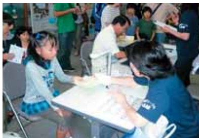
いろいろなボランティア体験を学びました