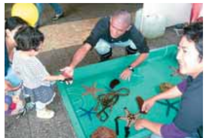
めずらしい海の生き物にドキドキ☆