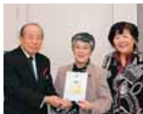
浦添市仲間1-10-7 浦添市第三民生委員 児童委員協議会 様より 21,430円 (チャリティーフリー マーケット売上金より)