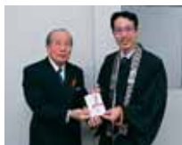
浦添市伊祖5-10-1 浄土真宗本願寺派 本願寺沖繩別院 様より 20,000円