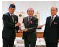
浦添市仲間1-10-7 浦添ライオンズクラブ 様より 50,000円