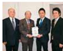
浦添市仲間1-10-7 公益社団法人 浦添青年会議所 様より 50,000円