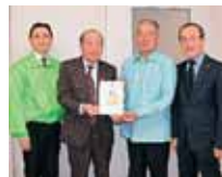
浦添市勢理客2-3-8 チャリティーロックライブ 実行委員会 STB 様より 50,000円