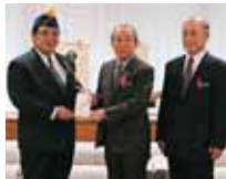
浦添市仲間1-10-7 浦添でだこ ライオンズクラブ 様より 50,000円