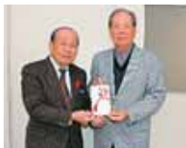
浦添市経塚876-2 有限会社 長浜冷機 様より 100,000円