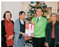
浦添市城間4-34-8 SDA浦添キリスト教会 様より お米 8箱(3kg入り)