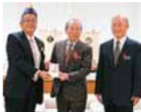
浦添市屋富祖2-20-8 浦添ウエスト ライオンズクラブ 様より 35,000円