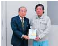
浦添市経塚291-3 株式会社 水星設備 様より 100,000円