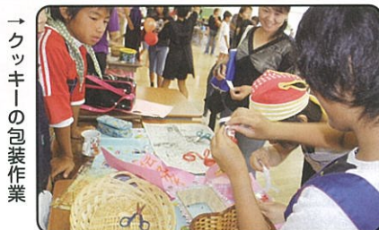
↑クッキーの包装作業