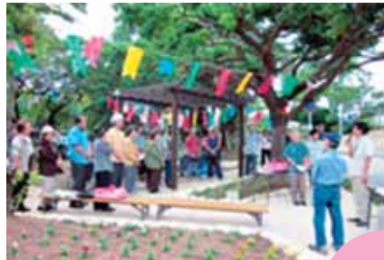
お披露目会には地域の方々をはじめ、うらそえぐすく児童センターの児童など60名のみなさんが公園完成を喜びました。