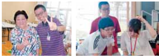
研修生のみなさん、本職に戻ってもがんばってください☆利用者・職員一同応援しています!!!

沖縄電力の新人社員のみなさんが、研修生として生きいき健康クラブを体験しました。ユニタクしたり、ゲームをしたり、若い研修生と一緒に楽しく過ごして、利用者みなさんはさらに若返りました。また、ときばきと動く研修生に職員も感心!!!