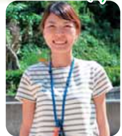
まえ ひら ゆう 真栄平 結