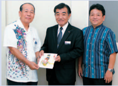
◎株式会社 サンレー 様より 浦添市前田2-15-1 50,200円