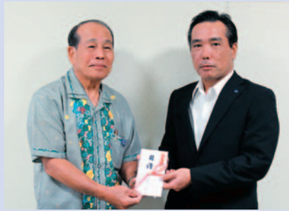
◎株式会社 サンシャイン 様より 宜野湾市志真志4-1-1 100,000円