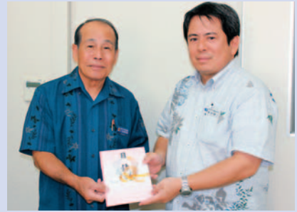
◎株式会社 沖縄建設技研 様より 浦添市宮城3-7-5-103号 100,000円 ※会社創立30周年を記念して