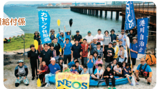
港川にあるカーミージーで港川自治会やアウトドアショップNEOS(牧港在)のサポートのもと、「カヤック体験会」をしました。