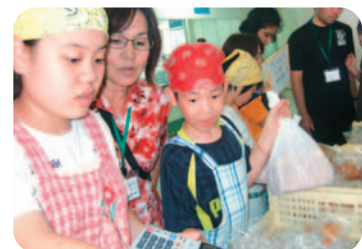
パン屋さんのアルペンローゼ(伊祖在)のご協力のもと、パンの販売を体験!

お問い合わせ 住所:浦添市経塚1-17-1 ゆいまーるセンター2F TEL:098-875-1503