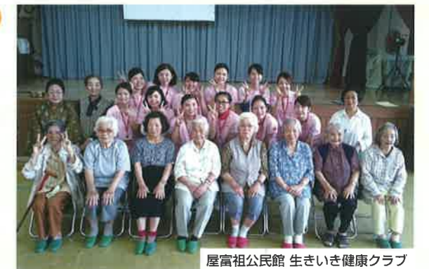
屋富祖公民館 生きいき健康クラブ