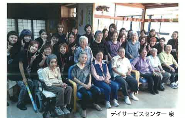
デイサービスセンター 泉

お問い合わせ先 学校法人KBC学園 専修学校 ビューティーモードカレッジ 電話 098-941-3159