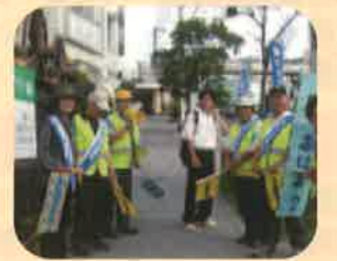
地域福祉活動 ~あいさつ運動~