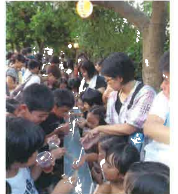
子どもまつりでの流しそうめんの様子

過日7月1日、てだこホールで本市の市政施行45周年が挙行されました。我が浅野浦自治会は40才を迎えます。 浦添市は、県内の市町村の中でもいち早く区画整理事業がスタートしたようです。伊祖1丁目、2丁目はパイプラインを挟んで昭和47年頃事業が完成し、畑の地名「浅屋原」をもじって区内の公園名を「浅野浦」と理事会で命名し、自治会名も「浅野浦」として決定したそうです。