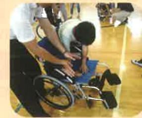
福祉教育 ~学校での車いす体験~

住民の皆さまが、地域で必要なサービスや支援を受けながら暮らし続けられる「安心して暮らせる福祉のまち」を目指し、地域福祉推進のために、皆さまからの善意をお待ちしています。