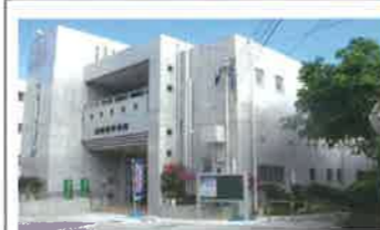
浅野浦公民館 【住所】浦添市伊祖1-25-2 【電話】098-878-8378