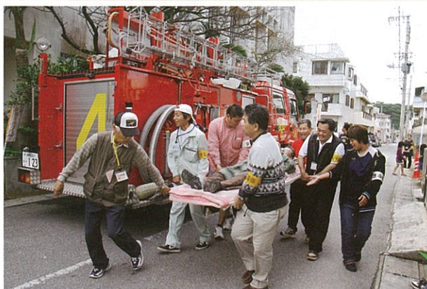
↑ 1月に行われた要援護者を含む牧港地域住民避難訓練の様子

第4民児協は、全国社会福祉協議会から助成を受け、平成20・21年度民生委員・児童委員活動振興事業を推進してきました。