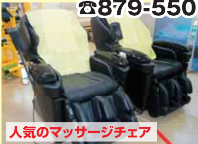
人気のマッサージチェア