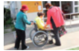
↑車イスでの移動は、少しの段差も大変!