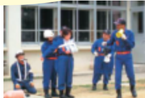
↑ビニール袋が三角巾に大変身!!