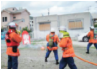
↑火災場所からみんなで公民館へ避難