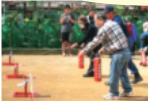
↑うまく消えるかな～