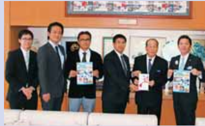
◎沖縄国際映画祭うらそえ応援団 様より 浦添市勢理客4-13-1 (浦添商工会議所内) 映画招待券100枚