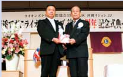
◎浦添てだこライオンズクラブ 様より 浦添市仲間1-10-7 100,000円 ※設立30周年を記念して