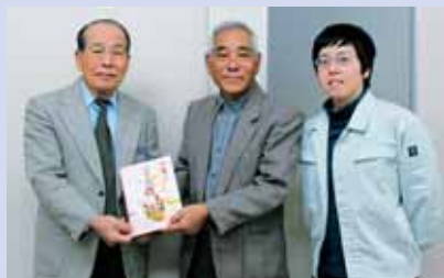
◎まなびフェスタ浦添2014 てだこ市民大学フェスティバル実行委員会 様より 浦添市安波茶1-1-1 (浦添市教育委員会 教育部 生涯学習振興課 てだこ市民大学事務局内) 30,000円