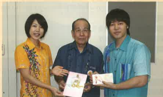
◎有限会社 あい保険工房 様より 浦添市宮城 2-24-2 図書券 30,000 円分 (500 円 × 60 枚) ※40 回目