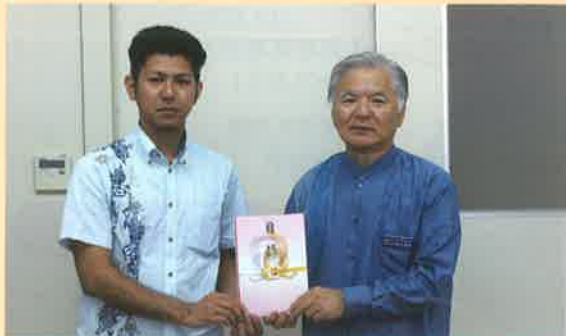
◎株式会社 朝日建設コンサルタント 様より 浦添市城間 3-9-1 30,000 円