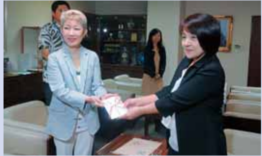
◎水前寺 清子 様より 母の日「ありがとう」コンサート収益から 100,000円 *母子生活支援施設「浦和寮」への指定寄付