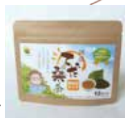
【てだ桑茶】 焙煎茶タイプ