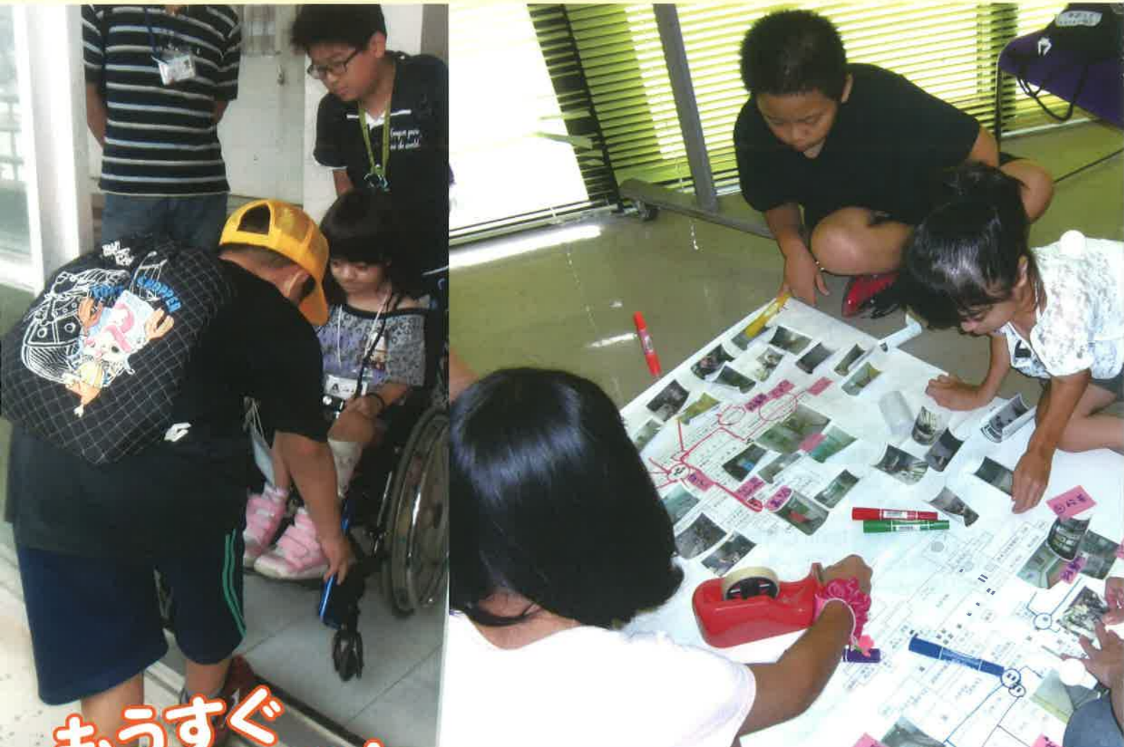
子どもモニター部会 バリアフリーチェック活動の様子：平成26年9月