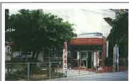
上野自治会 【住所】浦添市牧港5-19-2 【電話】098-876-0344

みんなは自分の住んでいる自治会がどんなのか、そして、どんな歴史があるのかわかるかな? 今回は、上野自治会について調査してきたよ!