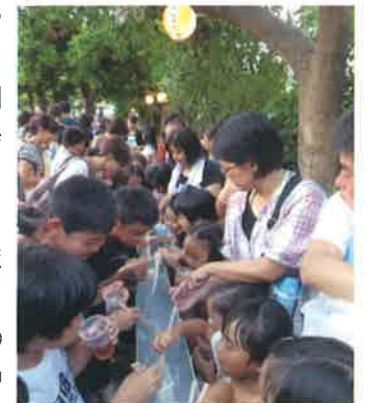
子どもまつりでの流しそうめんの様子

過日7月1日、てだこホールで本市の市政施行45周年が挙行されました。我が浅野浦自治会は40才を迎えます。 浦添市は、県内の市町村の中でもいち早く区画整理事業がスタートしたようです。伊祖1丁目、2丁目はパイプラインを挟んで昭和47年頃事業が完成し、畑の地名「浅屋原」をもじって区内の公園名を「浅野浦」と理事会で命名し、自治会名も「浅野浦」として決定したそうです。