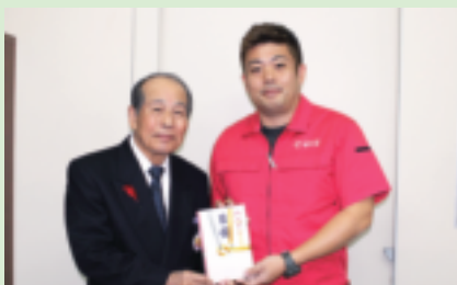
◎株式会社 タバタ 様より うるま市石川赤崎2-2-1 500,000円