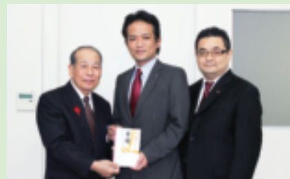
◎公益社団法人 浦添青年会議所 様より 浦添市仲間1-10-7 50,000円