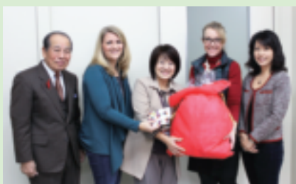
◎海軍将校婦人クラブ (NOSCO) 様より イオンギフトカード…………… 28,500円分 (1,500円×19枚) トイザラスギフトカード……… 61,500円分 (1,500円×41枚) (浦添市母子生活支援施設浦和寮への指定寄付)