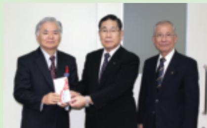
◎沖縄県警友会 様より 那覇市旭町7番地 サザンプラザ海邦内 50,000円