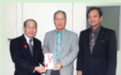
◎有限会社 長浜冷機 様より 浦添市経塚876-2 100,000円